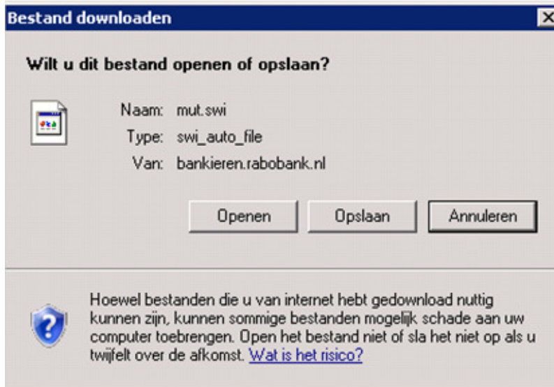
Afbeelding bij Stap 6

Stap 7 Selecteer de map die in SnelStart is opgegeven bij Map rekeningafschriften (zonder bestand) – zie Afbeelding bij Stap 7b.