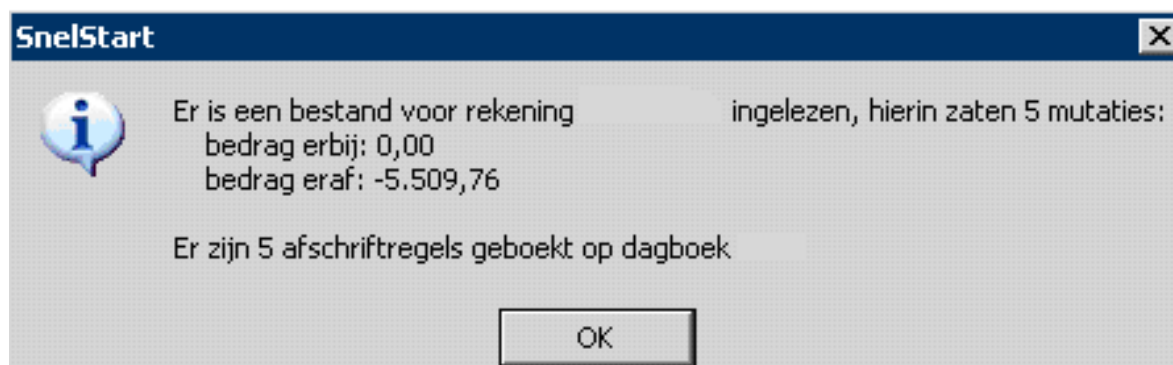
Afbeelding bij Stap 8

Ga nu naar SnelStart en de afschriften worden in gelezen.